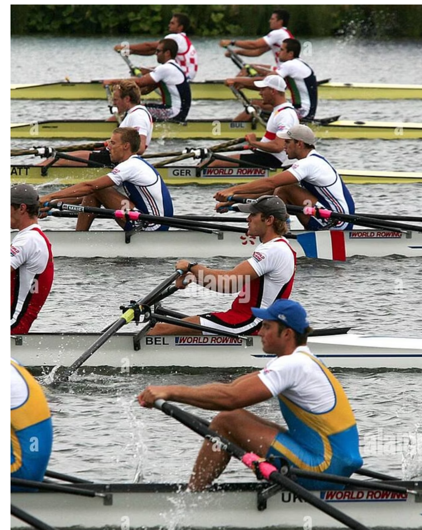
ROWING - WORLD CHAMPIONSHIPS 2006 - ETON (GBR) - 24/08/2006 FOTO : IGOR MEIJER / DPPI ILLUSTRATION / START / SEMI FINAL

Il criterio utilizzato per la collocazione degli atleti nelle semifinali ha considerato il tempo registrato in batteria.