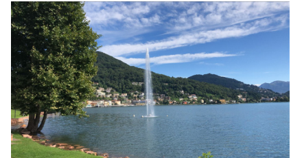
Golfo di Lavena-Ponte Tresa (ITA)