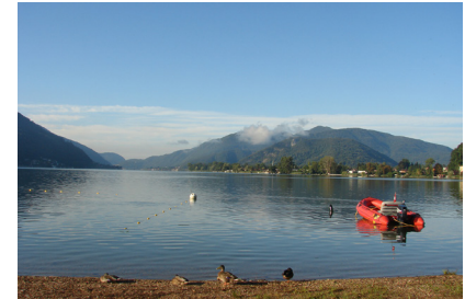
Golfo di Agno (SUI).