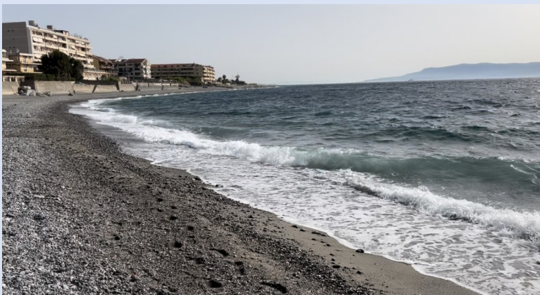
Partenza da Mili Marina

La mattina del sesto giorno il mare non si presentava certo migliore del pomeriggio precedente, ma confidando nel fatto che la corrente era sempre a favore e avendo constatato che la “nostra” barca reggeva più che egregiamente il moto ondoso abbiamo continuato a “discendere” lo Jonio. A fine mattinata, dopo avere ammirato, prima il Castello Rufo Ruffo di Scaletta, e ancor di più il Castello di S. Alessio Siculo, abbiamo fatto una delle soste più magiche della nostra avventura: abbiamo raggiunto la spiaggia di fronte Isola Bella, godendo di uno tra i luoghi più suggestivi della Sicilia, accompagnati dallo sguardo un po’ incuriosito dei tantissimi turisti che affollavano la spiaggia, che osservavano due signori, di “abbondante” mezza età, mentre sbarcavano da una imbarcazione sconosciuta ai più. Superata la spiaggia di Giardini Naxos, dopo oltre 50 km remati, abbiamo trovato riparo dalle onde nel Porto di Riposto. Qui, lasciata la barca in uno scivolo di un piccolo cantiere navale, siamo andati a dormire in un B&B.