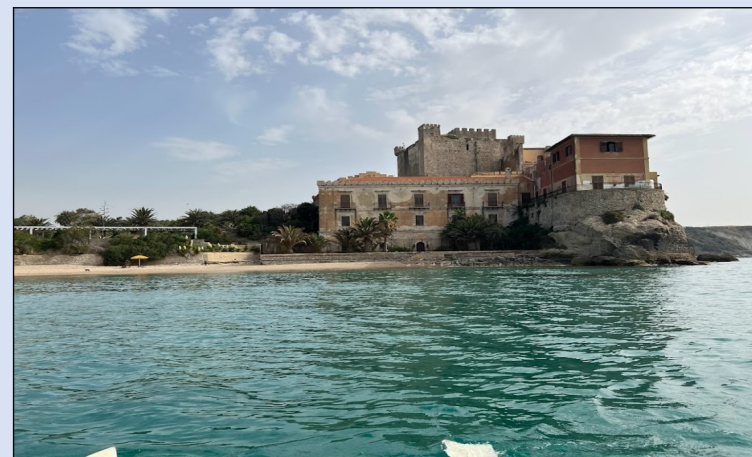
Castello di Falconara