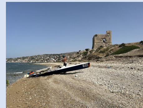
Torre S. Carlo