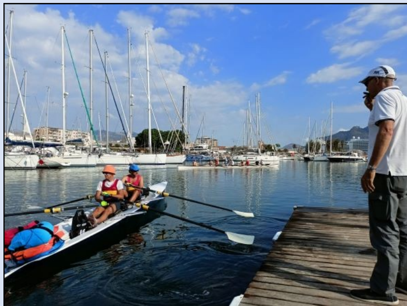
Partenza in doppio dal molo della SCP

Quest'anno la nostra avventura in doppio, un robusto ed affidabile Coastal della Donoratico, che prevedeva di viaggiare in modo del tutto autonomo, portandoci con noi il minimo necessario per campeggiare, (non disdegnando, però, di dormire nei B&B), richiedeva di percorrere circa 700 km con un'unica certezza: cercare di arrivare a Sciacca in, al massimo, sedici giorni.