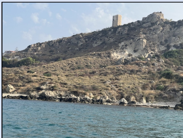
Torre San Nicola

incontaminate e scogli e falesie dai mille colori: la Rocca e la Torre San Nicola, la Torre di Gaffe, la Torre San Carlo, la Baia delle Sirene, il Castello Chiaramontano, e la Punta Bianca ( che con la sua caserma della Finanza abbandonata ha un fascino ancora più inusuale). La nostra