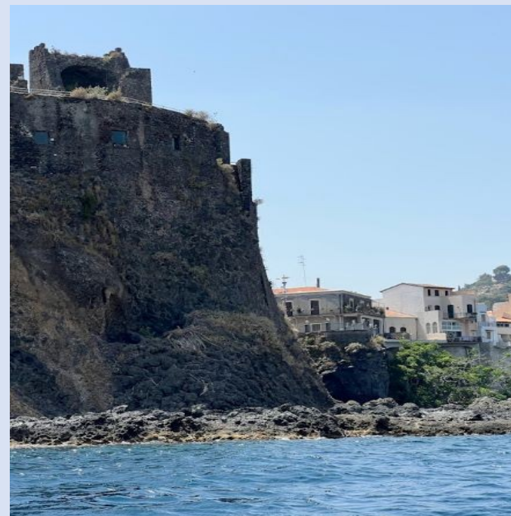
Rocca e Castello di Acicastello