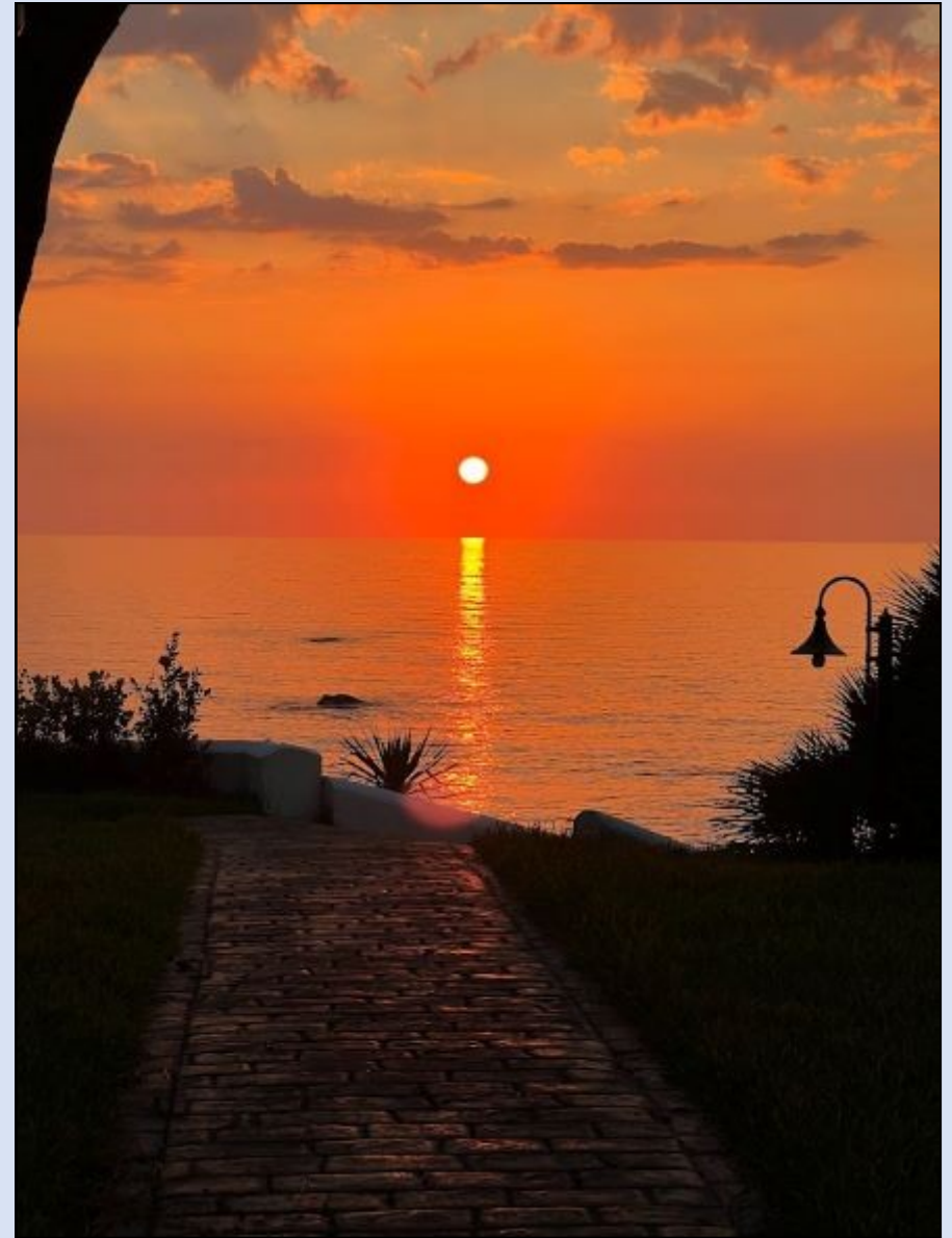
Torre del Lauro al tramonto