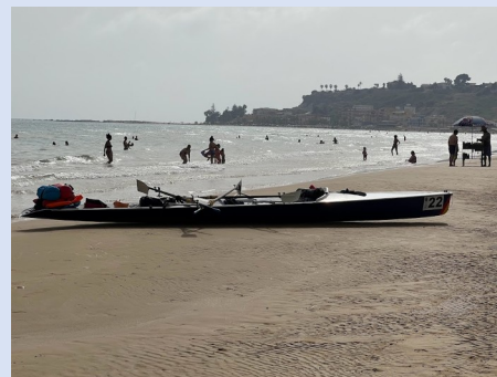
Spiaggia di Porto Empedocle