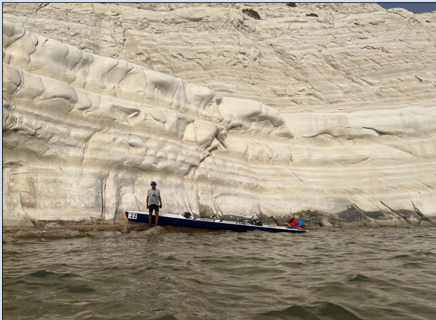
Scala dei Turchi