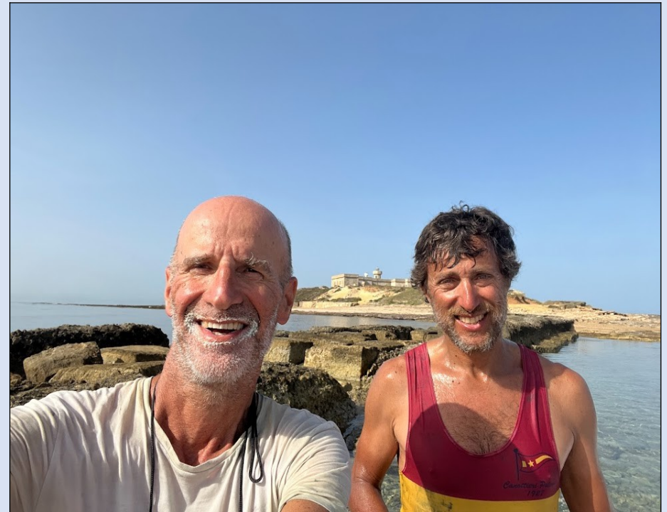
Sullo sfondo Isola delle Correnti

Il primo significativo obiettivo della decima giornata è stato l'attraversamento dello "stretto" tra la terra ferma da un lato, con la Statua del Cristo Redentore e dall'altro l'Isola delle Correnti. Davanti a noi, o meglio dietro di noi, visto che nel canottaggio si avanza con la schiena rivolta a prua, il Canale di Sicilia! Una navigazione abbastanza tranquilla e senza troppe soste tecniche o "turistiche" ci ha fatto raggiungere Punta e Cozzo Ciriga con le sue calette naturali, il porto di Pozzallo, la caratteristica Fornace Penna, Cava D'Aliga, per un meritato riposo e, per finire la giornata, Marina di Ragusa. Qui abbiamo mangiato in una pizzeria e dormito in un campeggio, godendo in entrambi i luoghi della simpatia e dello spirito di accoglienza delle due strutture. Una citazione particolare merita la Foce del Fiume Irminio: poco prima di arrivare a Marina di Ragusa, sbarcati per dare un'occhiata, siamo stati colpiti dalla varietà di versi che i tanti uccelli producevano.