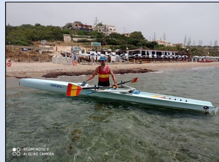
Arrivo a San Marco - Sciacca