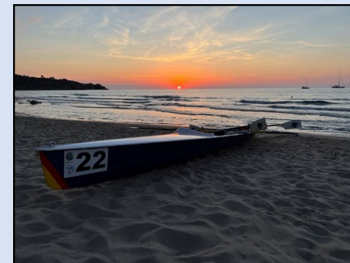
Arrivo al tramonto sulla spiaggia di Cefalù

Progetto minimalista, ma ragionevole, della navigazione: Si naviga a vista, viaggiando leggeri!