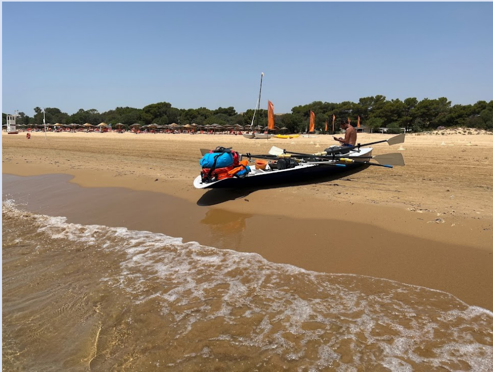
Spiaggia di Pozzallo

Mantra durante l'attraversamento dei golfi particolarmente "lunghi": "Davanti a noi vedere la punta da cui eravamo partiti, che man mano si allontanava, ci confortava sul fatto che, dietro di noi, quel punto di arrivo, che sembrava sempre lontano, era sempre un po' più vicino"