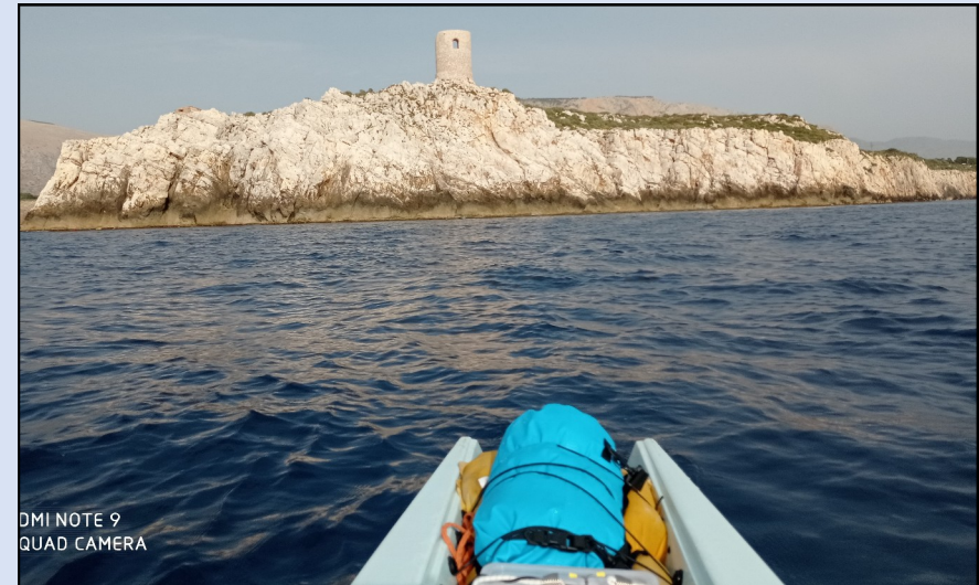
Scogliera di Terrasini