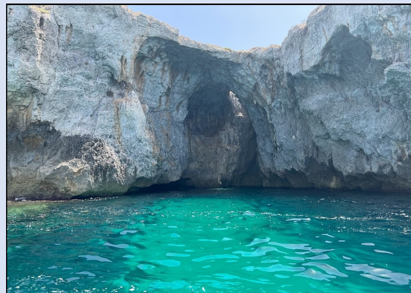
Una delle tante grotte nei pressi di Punta Cannone