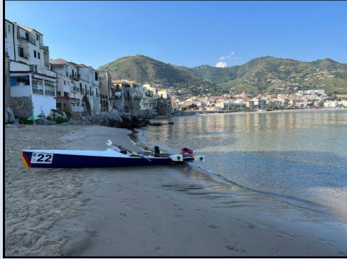
Posteggio alla Marina di Cefalù per un caffè

La mattina del secondo giorno, dopo avere raggiunto la “Marina” di Cefalù con la barca, per un caffè, abbiamo goduto uscendo dal porto, della superba vista dal mare del Duomo e della Rocca di Cefalù. Di seguito la costa palermitana e poi messinese ci hanno regalato meravigliosi scorci delle Madonie e dei Nebrodi, con le loro montagne, spesso, quasi a strapiombo sul mare. Nel pomeriggio, accontentandoci di percorrere poco più di 40 km ci siamo fermati a Torre del Lauro