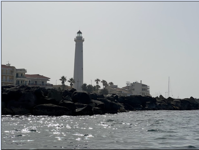
Faro di Punta Secca