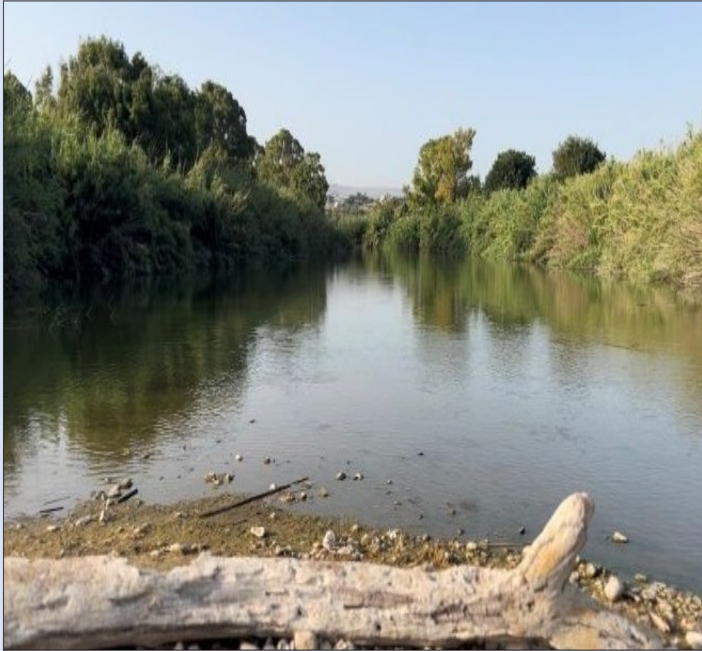
Foce del Fiume Irminio