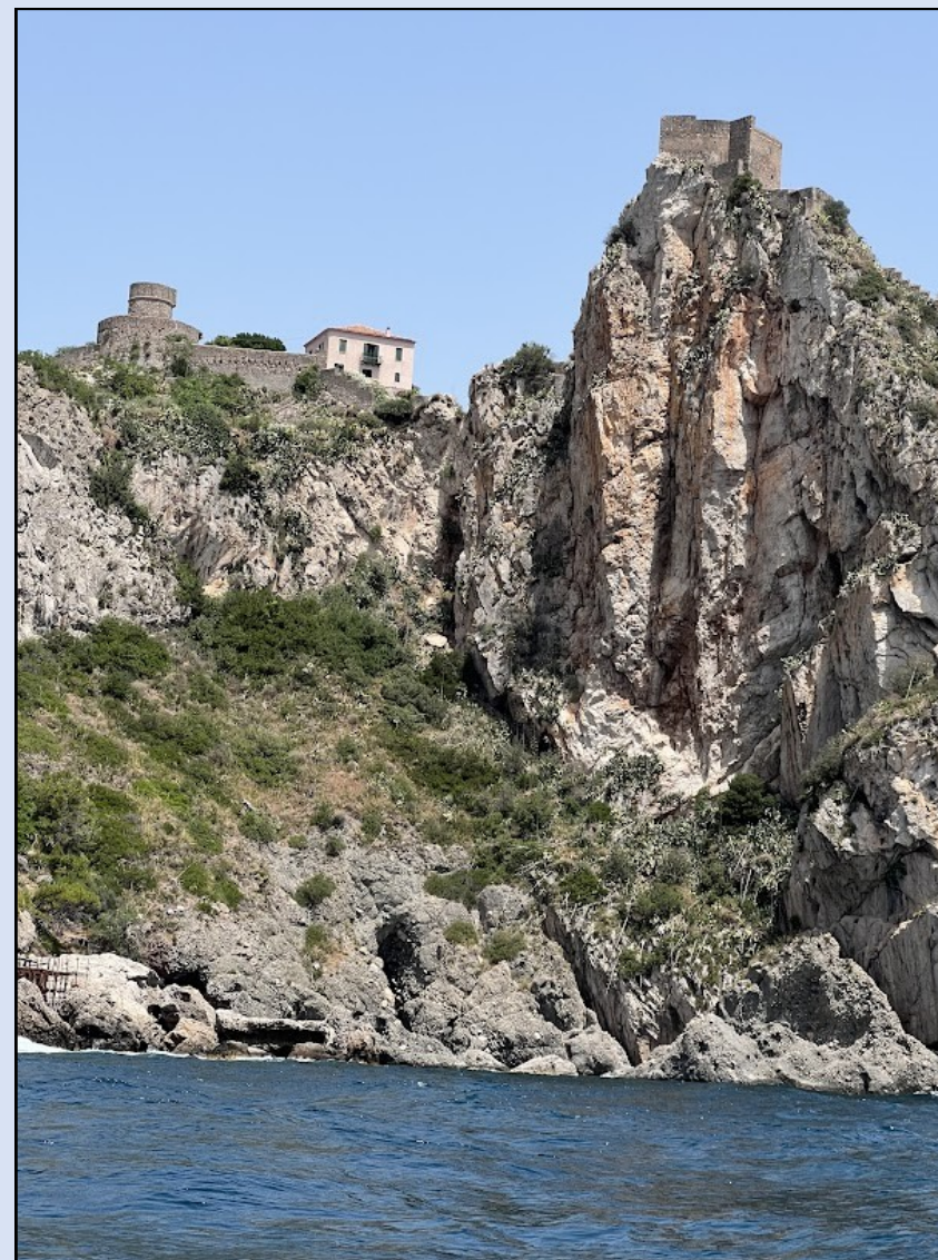
Castello di S. Alessio Siculo