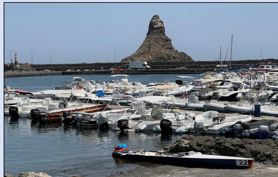
Isole dei Ciclopi dal Porto di Acitrezza; in primo piano la nostra amata barchetta

Il settimo giorno altri scorci di impareggiabile bellezza: le Isole dei Ciclopi di fronte il porticciolo di Acitrezza e la Rocca su cui troneggia il Castello di Acicastello. Nel pomeriggio del settimo giorno anche il Guerriero si riposa (citazione semibiblica!) e superato pure il porto di Catania, proseguendo, con una navigazione finalmente tranquilla e rilassata, abbiamo costeggiato il lunghissimo tratto di spiaggia catanese arrivando ad Agnone, chiamata così, forse, perché proprio in corrispondenza di questo punto un promontorio fa "angolo", interrompendo bruscamente la lunghissima lingua di sabbia. Approfittando della relativa tranquillità abbiamo deciso di montare la tenda in spiaggia e mangiare la cena, a base di pesce, in un ristorante sul mare.