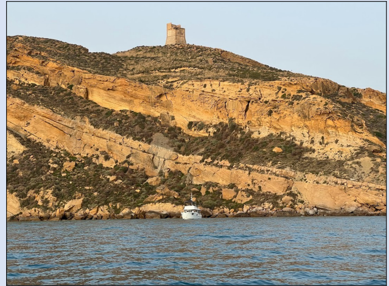
Torre di Monerosso