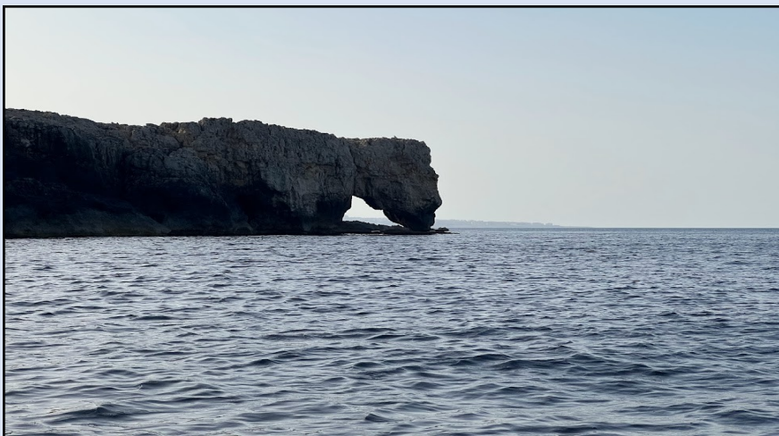
Riserva Naturale del Plemmirio Scoglio dell'elefante