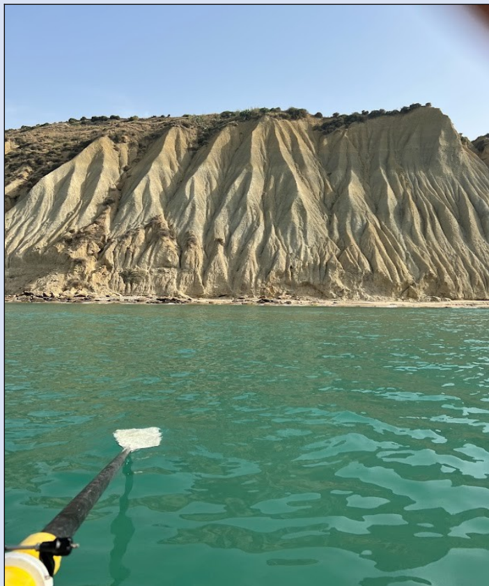
Marina di Butera