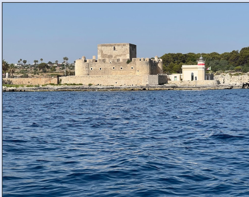
Castello di Brucoli