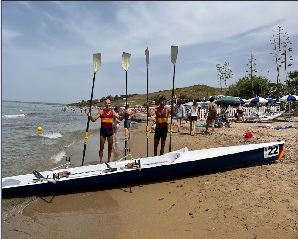
Arrivo a Capo San Marco - Sciacca

D'obbligo, la stessa sera dell'arrivo, la cena a base di pesce al Ristorante "Baia del Sol" di San Marco, proprio accanto a dove avevamo spiaggiato la nostra barca, fino a quel momento inseparabile compagna di avventura, e dove, in due anni diversi effettuando il periplo della Sicilia a remi, sono arrivato, in entrambi gli anni, proprio sotto il loro stabilimento balneare, ma venendo da direzioni opposte!"