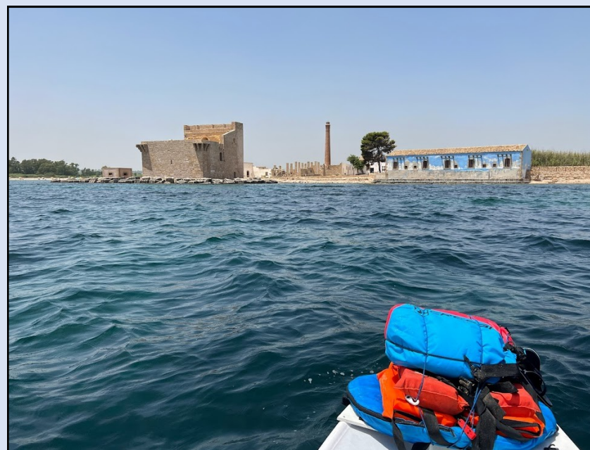
Torre e Tonnara di Vendicari