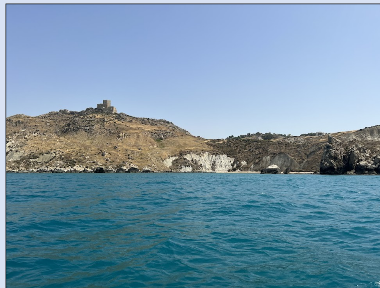
Castello di Chiaramontano e Spiaggia delle Sirene

splendida cavalcata delle onde ha avuto una meritata pausa sulla spiaggia di Porto Empedocle. Dopo una pausa, l'ennesima granita ed un improbabile ma apprezzato panino e panelle, abbiamo proseguito con una fermata d'obbligo alla Scala dei Turchi, dove abbiamo avuto la fortuna di passare e scattare alcune foto prima che i turisti "terrestri" invadessero questa meravigliosa falesia di marna di un bianco quasi abbagliante. Altra e sempre affascinante torre, la Torre di Monterosso e, finalmente, dopo altri chilometri di spiagge ancora da scoprire e da salvare ed oltre 60 Km vogati e, quasi, non sentiti, abbiamo concluso la nostra fatica giornaliera a Siculiana Marina "dormendo" in tenda (le virgolette sono d'obbligo causa le solite stuoie dallo spessore "stitico") e mangiando al ristorante dello stesso Camping.