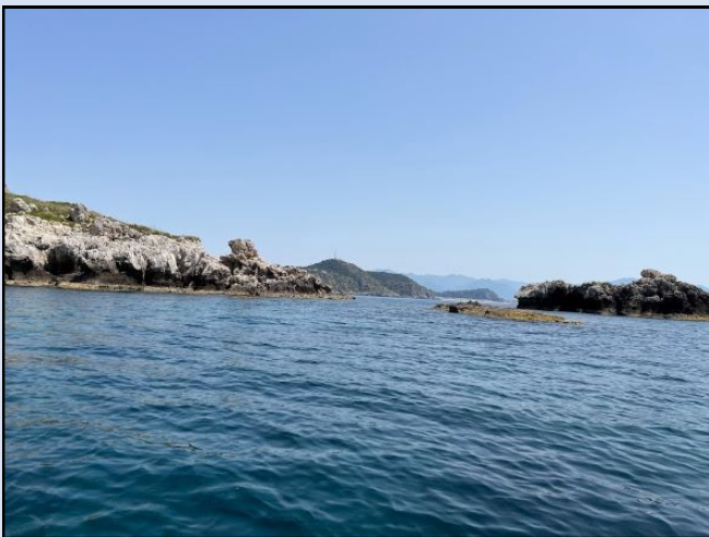
Portella del Carciofo

Lasciando Marinello con una traversata di quasi tre ore abbiamo raggiunto quasi l'estremità della lunghissima lingua di terra che caratterizza il territorio di Milazzo fermandoci proprio sotto Milazzo per una pausa meritata; quindi abbiamo doppiato, prima, i bellissimi Scogli della Portella del Carciofo e dopo Capo Milazzo. Dopo una navigazione che ci ha consigliato, per