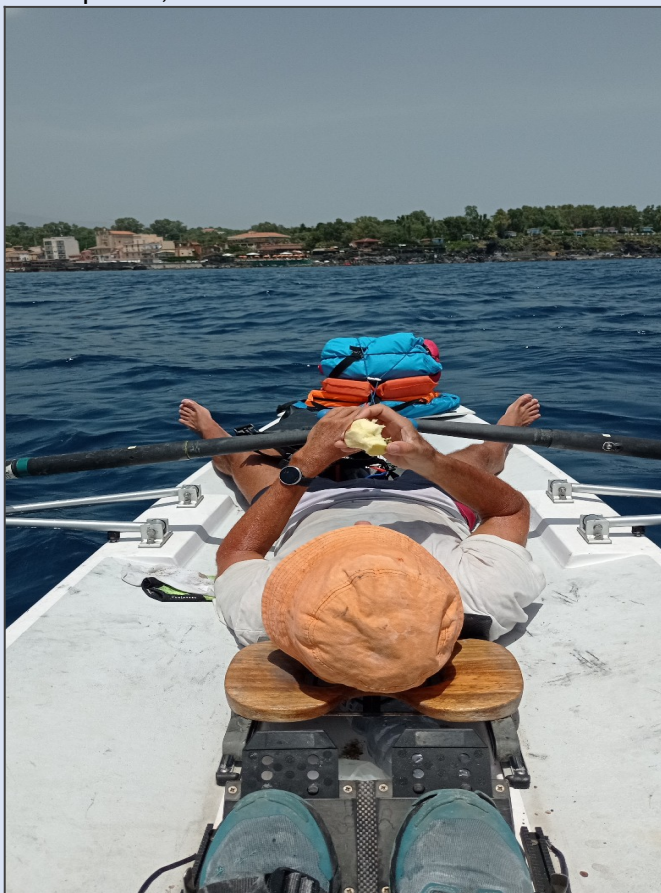
"Settimo Giorno: anche il Guerriero si riposa!"