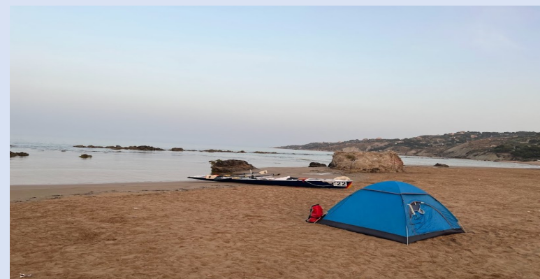
Spiaggia di Licata con le due nostre "case"