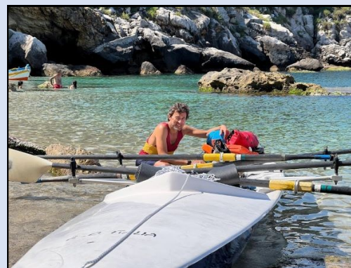
Spiaggia dei Francesi

La mattina dell'18 giugno, alla partenza dal molo della Società Canottieri Palermo, siamo stati accompagnati, fin quasi sotto Mongerbino, dall'otto yole dei nostri amici della Canottieri Palermo. Da lì abbiamo remato, con delle pause, la Spiaggia dei Francesi proprio sotto Mongerbino, Trabia e Campofelice di Roccella, mangiando e riposandoci a terra, ma anche tonificando i muscoli, buttandoci direttamente in acqua dalla barca, fino ad arrivare alla spiaggia di Cefalù dopo dodici ore e oltre 65 km. Quella prima notte dopo avere faticato a montare per la prima volta la tenda, comprata per l'occasione, abbiamo faticato pure a dormire per via di una discoteca che ci ha deliziati con la sua "musica" fino alle tre di notte!