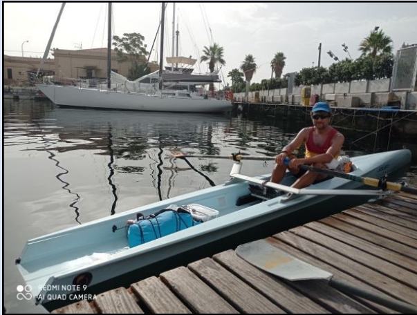
Partenza in singolo dal molo SCP