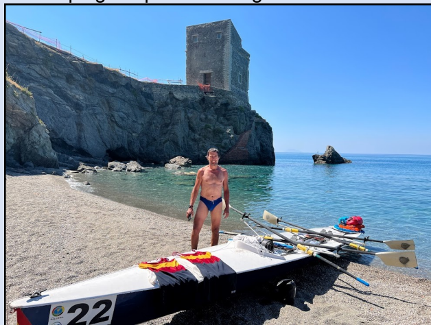
Torre delle Ciavole

Dopo avere raggiunto e riposato presso uno stabilimento balneare di Capo D'Orlando, abbiamo remato, passando da diversi punti che rimarranno cristallizzati nella nostra memoria: la Torre delle Ciavole, Capo Calavà, la Pietra di Patti e, la bellissima costa tra Mongione e Tindari per arrivare stanchi ma soddisfatti, dopo avere doppiato la lunga lingua di sabbia che caratterizza la Riserva Naturale Orientata dei Laghetti di Marinello, proprio sotto il Santuario di Tindari, dormendo in un bungalow di un camping nei pressi dei laghetti.