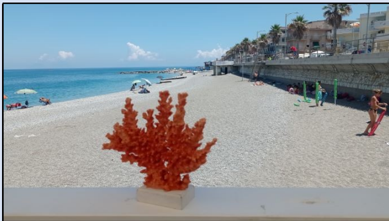
Scorcio della Spiaggia di Capo D'Orlando da stabilimento balneare

Dopo avere raggiunto e riposato presso uno stabilimento balneare di Capo D'Orlando, abbiamo remato, passando da diversi punti che rimarranno cristallizzati nella nostra memoria: la Torre delle Ciavole, Capo Calavà, la Pietra di Patti e, la bellissima costa tra Mongione e Tindari per arrivare stanchi ma soddisfatti, dopo avere doppiato la lunga lingua di sabbia che caratterizza la Riserva Naturale Orientata dei Laghetti di Marinello, proprio sotto il Santuario di Tindari, dormendo in un bungalow di un camping nei pressi dei laghetti.