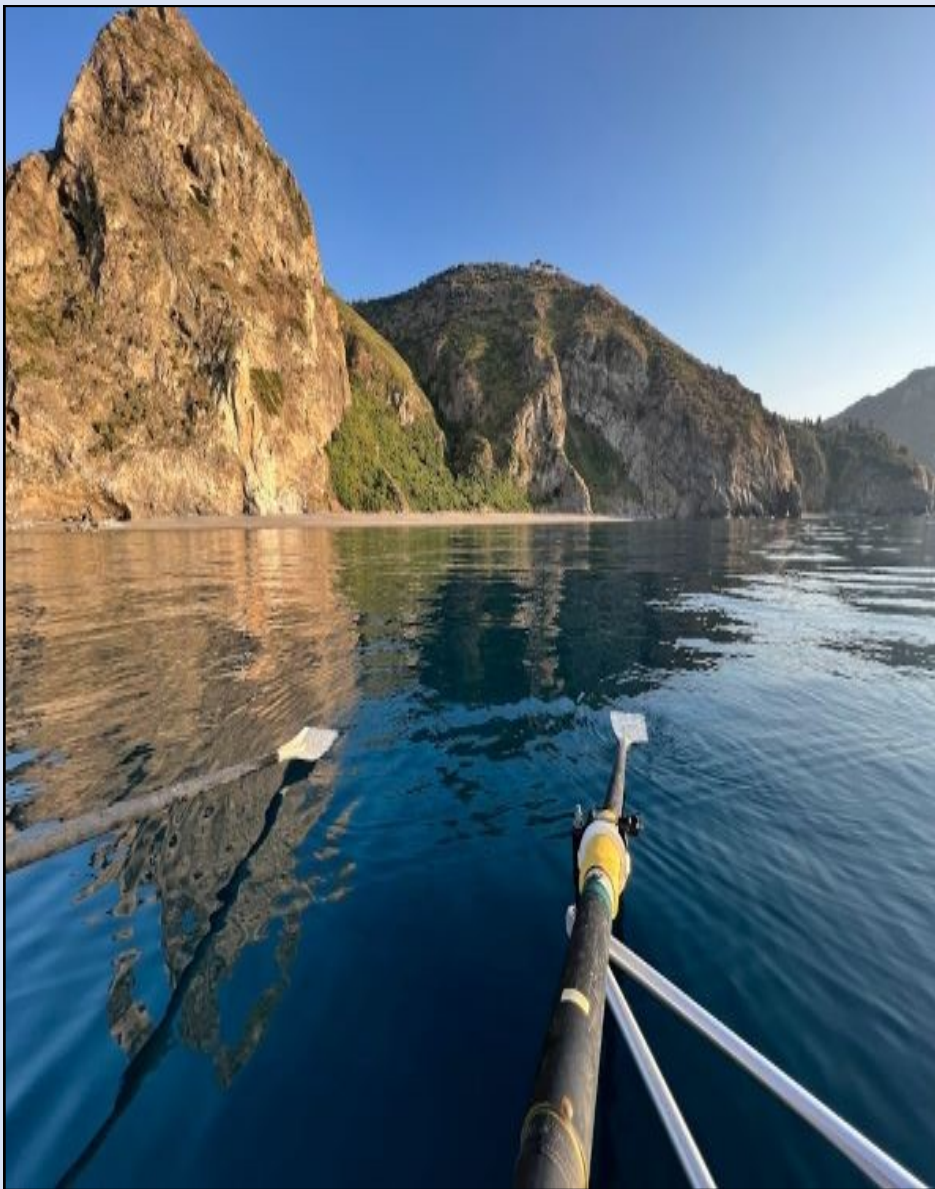
La costa sotto Tindari