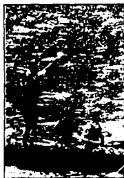
I vincitori dell'Italia