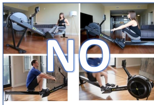
ERRATA collocazione dello smartphone durante la gara