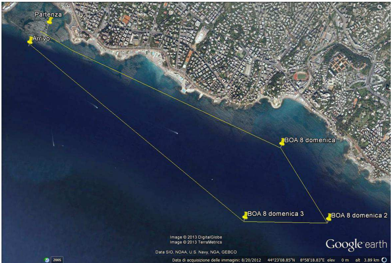
Figura 3. Il percorso delle gare finali con arrivo esterno al porto