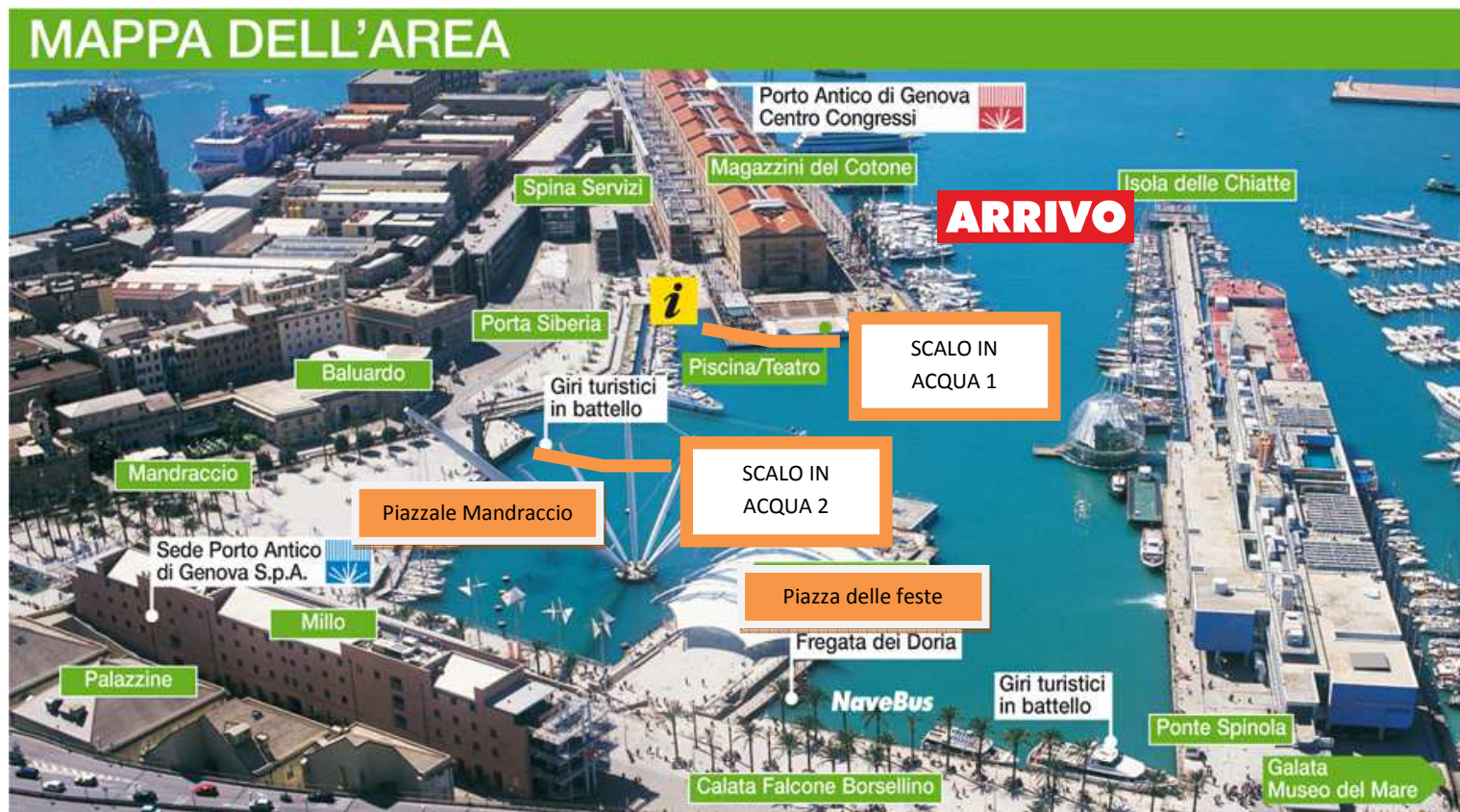
La planimetria del Villaggio del Campionato