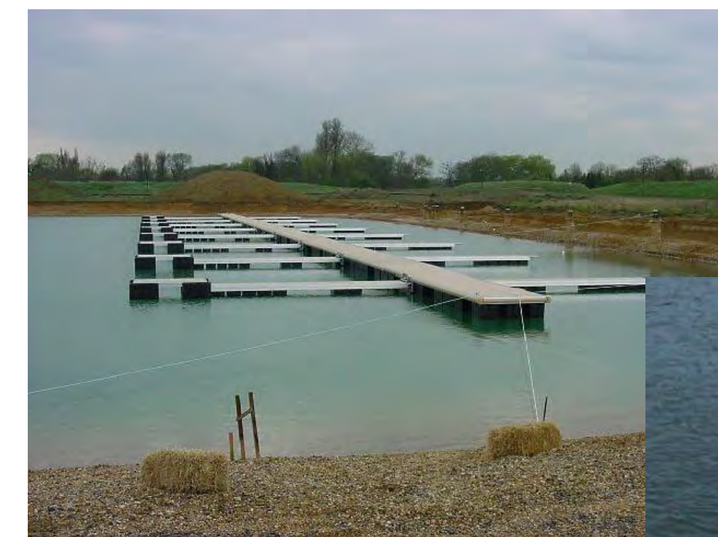
PARTICOLARE DI UN PONTILE DI INBARCO SBARCO