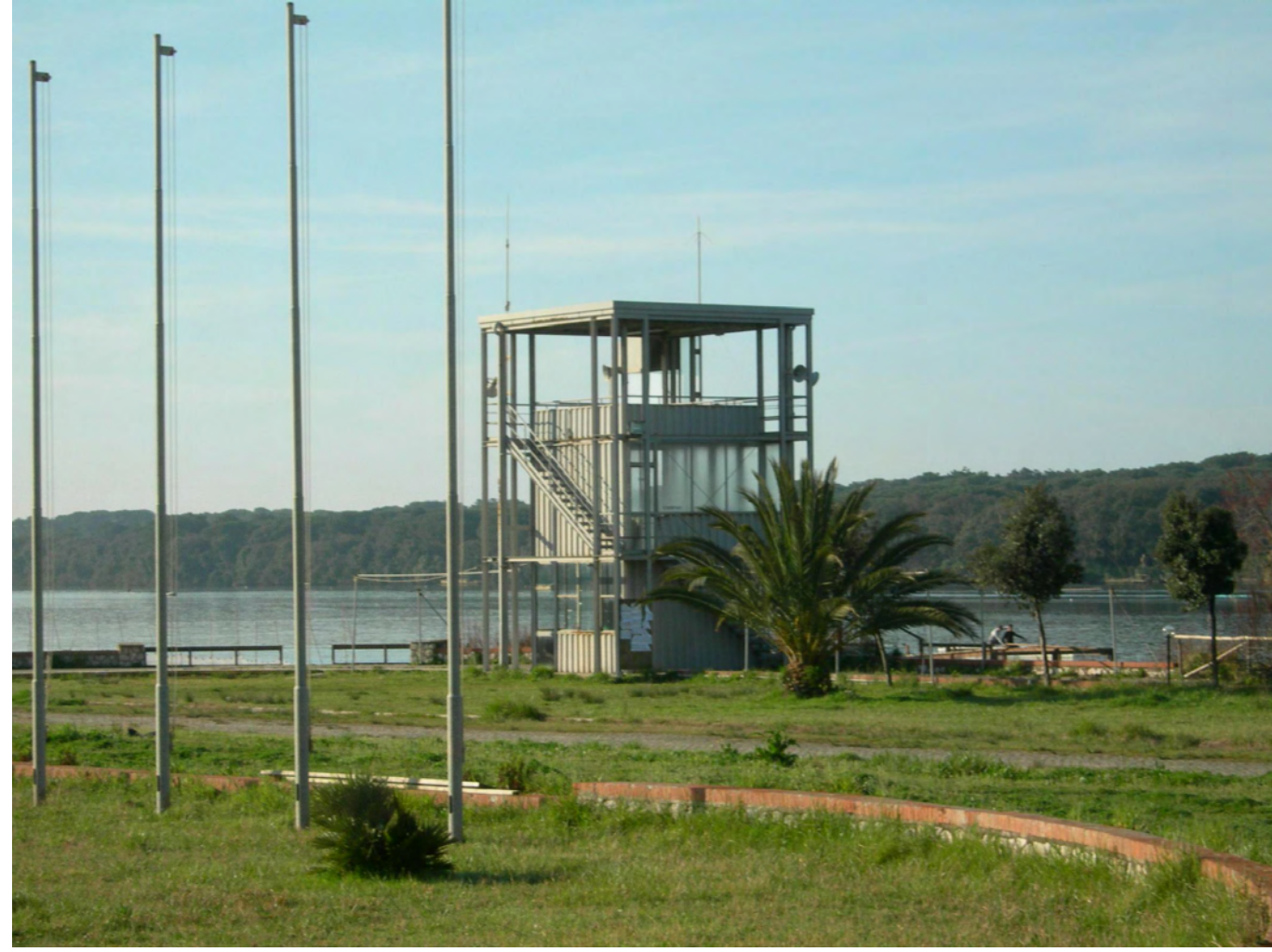
PARTICOLARE TORRE GIURIA