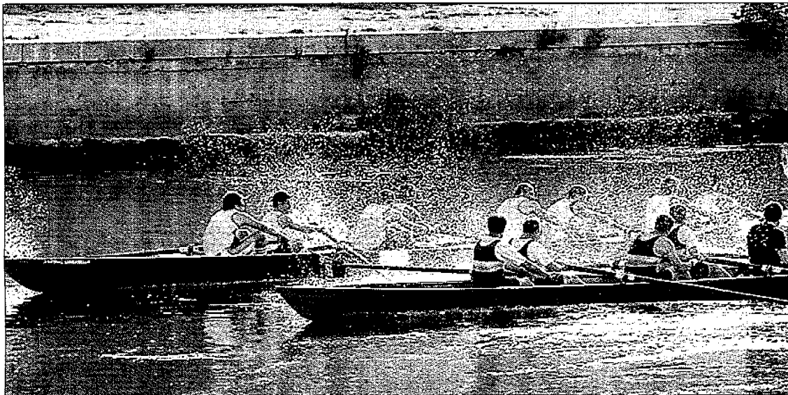
Non solo canottaggio, i circoli preparano le loro "Olimpiadi" con squadre di ex campioni e semplici soci De Martino all'interno