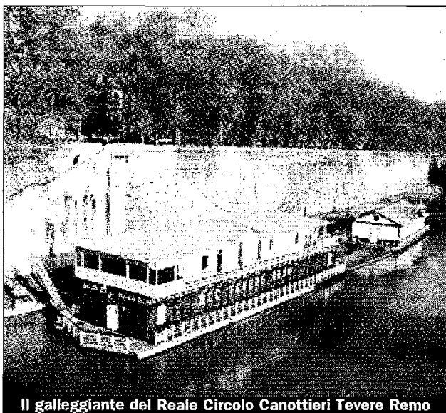
Il galleggiante del Reale Circolo Canottieri Tevere Remo