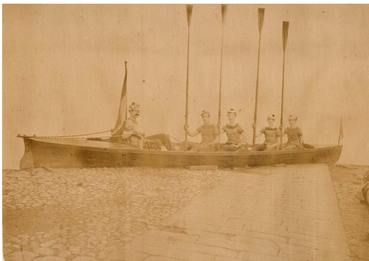
L'equipaggio della S.G.L. “C.Colombo” protagonista del raid Genova-Roma del 1880

Ricerca a cura di CLAUDIO LORETO (Gruppo Sportivo “Speranza” – Genova) Gennaio 2007