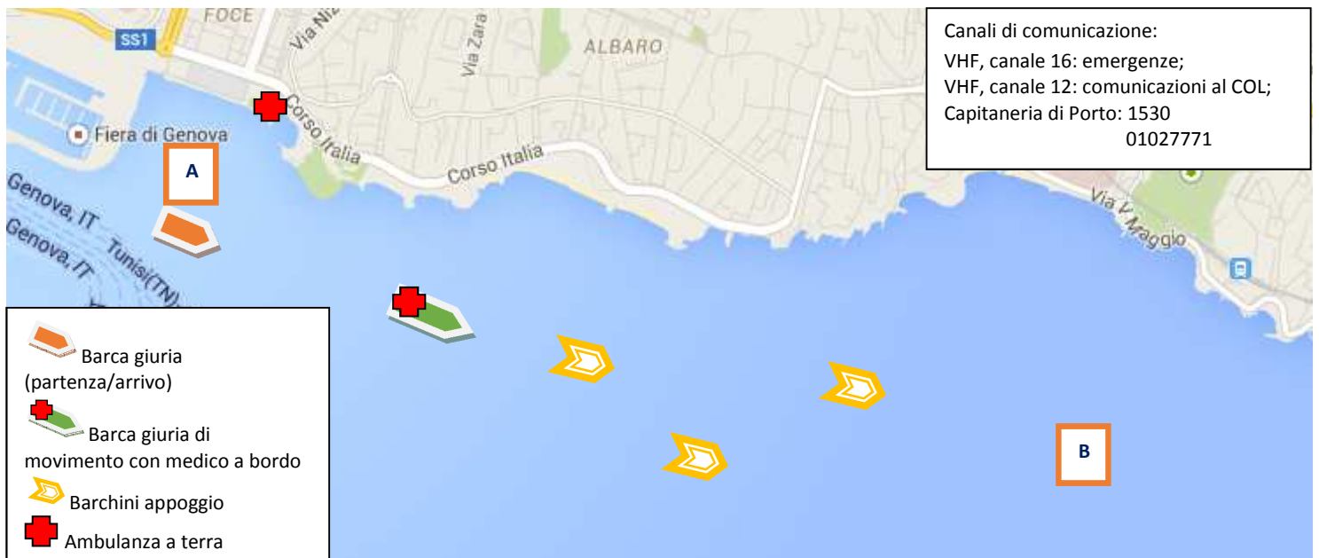
Figura 4. Indicazioni sulla sicurezza in mare.