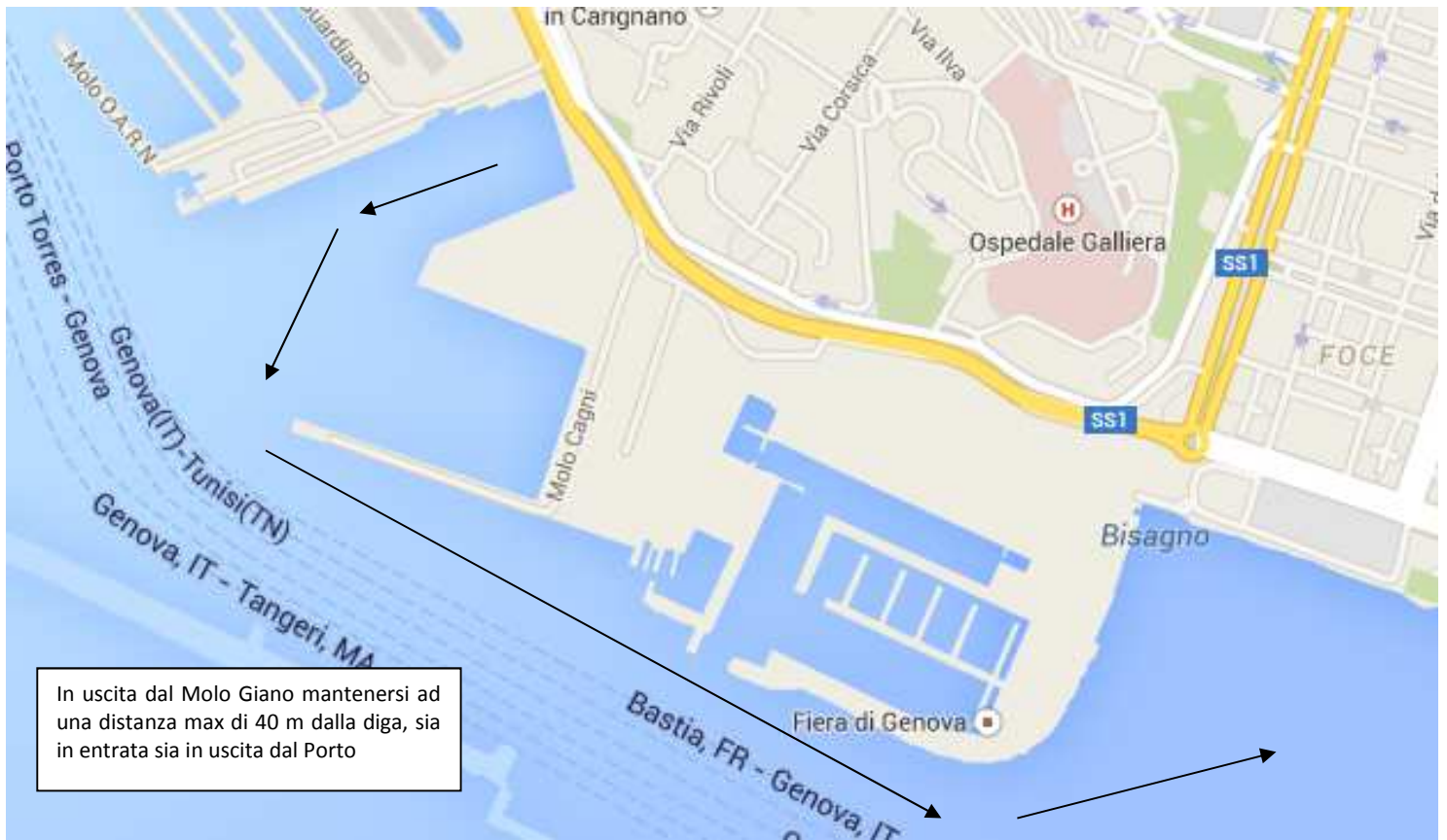
Figura 3. Istruzioni per l'ingresso e l'uscita dal porto.