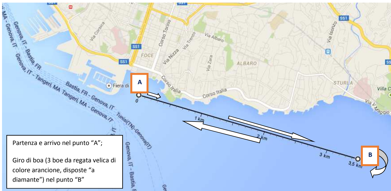
Figura 1. Il percorso di gara