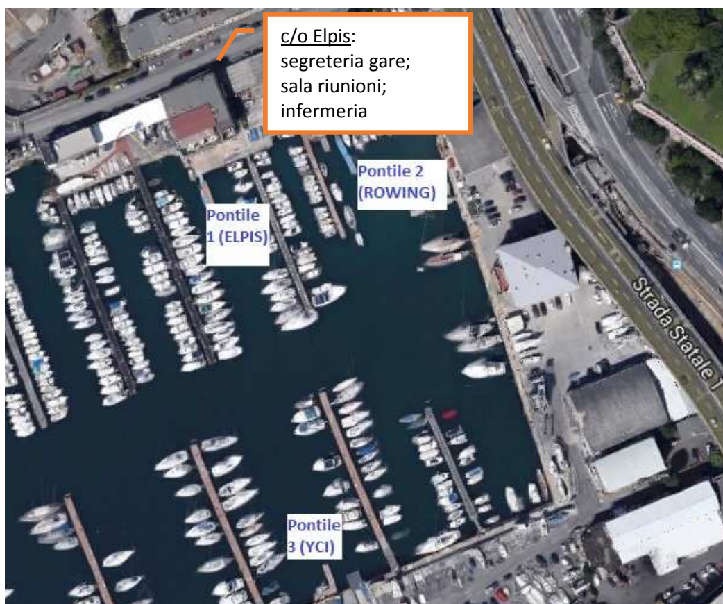
Figura 2. Indicazione dei pontili di discesa e risalita